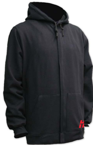
Arc-rated metalworking jersey Chandail anti-arcs pour le travail des métaux Chaqueta para metalistería, evaluada para arco Pullover für Metallarbeiten mit Arc-Rating-Siegel

ANSI Z87.1, CSA Z94.3, CE 017033 Shade 5 | Teinte 5 Sombra 5 | Tönungsnummer 5