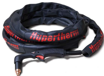
Leather torch sheathing Revêtement de torche en cuir Funda de cuero para antorcha Leder-Brennerüberzug