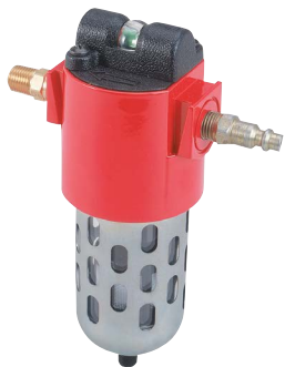
Air filtration kits Kits de filtration de l'air Juegos de filtración de aire Luffilter-Sets