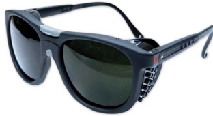
Adjustable eye shades Visières ajustables Gafas ajustables Verstellbarer Augenschirm

ANSI Z87.1, CSA Z94.3, CE 017035 Shade 5 | Teinte 5 Sombra 5 | Tönungsnummer 5