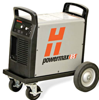
Wheel/gantry kits Kits de roue/portique de découpe Juegos de ruedas/pórtico Rad/Portal-Schneidmaschinen-Sets