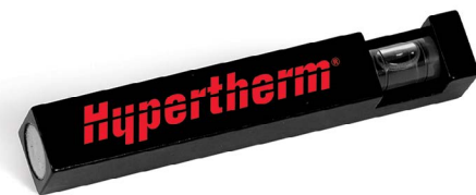
Pocket level and tape magnet Niveau de poche et support aimanté de ruban Nivel de bolsillo y porta cinta adhesiva Taschenwasserwaage und Bandmagnet