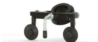
Bevel cutting guide Guide de coupe pour le chanfrein Guía de corte en bisel Führung zum Fasenschneiden

017059 Standard | Standard Estándar | Standard 017058 Duramax Hyamp™