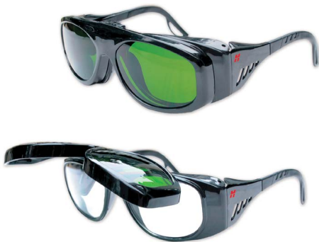
Flip-up eye shades Visières basculantes Gafas con sombra abatible Hochklappbarer Augenschutz

ANSI Z87.1, CSA Z94.3, CE 017033 Shade 5 | Teinte 5 Sombra 5 | Tönungsnummer 5