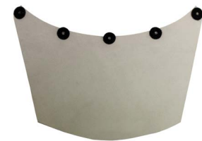
Neck guard Protection pour le cou Protector para el cuello Nackenschutz

017032 1.5 m x 1.8 m (5' x 6'), .5 kg (18 oz.)