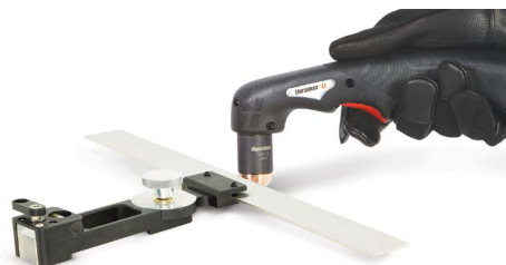
Angle cutting guide Guide de coupe d'angle Guía de corte en ángulo Winkel-Schneidführung

127102 Basic | De base Básica | Grundauführung 027668 Deluxe | De luxe Deluxe | Deluxe 017053 Duramax Hyamp™