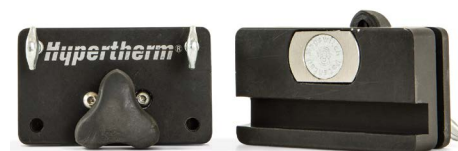
Magnetic block 3-pack Ensemble de 3 blocs aimantés Paquete de 3 bloques magnéticos Magnetfuß (3er Pack)

017059 Standard | Standard Estándar | Standard 017058 Duramax Hyamp™