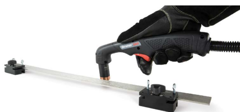
Magnetic straight edge Règle aimantée Borde recto magnético Gerade Magnetkante