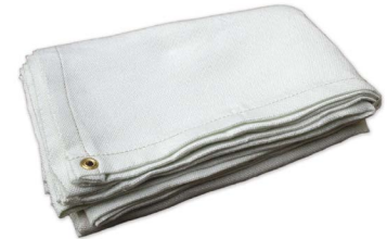
Cutting blanket Couverture pour la coupe Manta para corte Schneidecke

017016 Medium | Moyen Medio | Medium 017017 Large | Grand Grande | Large 017018 X-large | T grand Extra grande | X-large 017019 2X-Large | TT grand Doble extra grande | XXL 017020 3X-Large | TTT grand Triple extra grande | XXXL