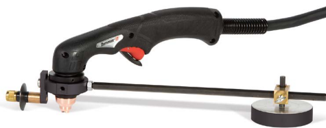
Circle cutting guide Guide de coupage circulaire Guía de corte circular Kreisschneideinrichtung

127102 Basic | De base Básica | Grundauführung 027668 Deluxe | De luxe Deluxe | Deluxe 017053 Duramax Hyamp™