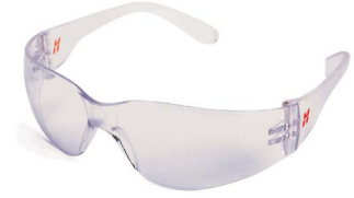
Clear safety shields Protections de sécurité transparentes Viseras de seguridad transparentes Transparenter Augenschutz

127416 Shade 5 | Teinte 5 Sombra 5 | Tönungsnummer 5