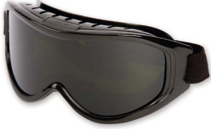
Cutting goggles Lunettes de sécurité pour la coupe Gafas de seguridad para corte Schutzbrille für Schneidanwendungen

ANSI Z87.1, CSA Z94.3, CE 017035 Shade 5 | Teinte 5 Sombra 5 | Tönungsnummer 5